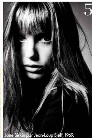
Jane Birkin par Jean-Loup Sieff, 1969.

● Du 26 mars au 14 mai, "Impatience", 11, rue de la Calade (09 80 59 01 06). www.flairgalerie.com