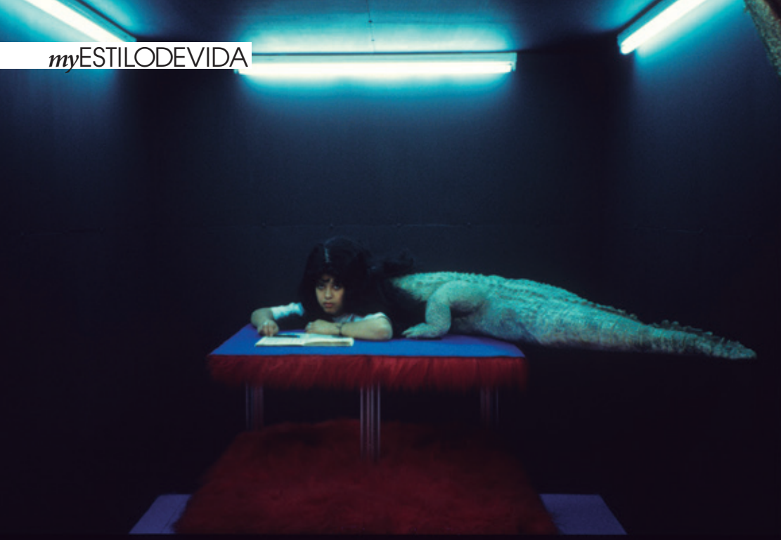
Obra expuesta La femme croco, París. 2000. Fotografía de Dolores Marat. Filmación de película, Fresson. 40 x 60 cm. © Dolores Marat, cortesía de Galerie Françoise Besson.

En Francia, al igual que en España, el peso de las tradiciones y la cultura sigue estando muy presente en las sociedades, como pueden ser la caza y las corridas de toros. ¿Cuál es su opinión a este respecto?