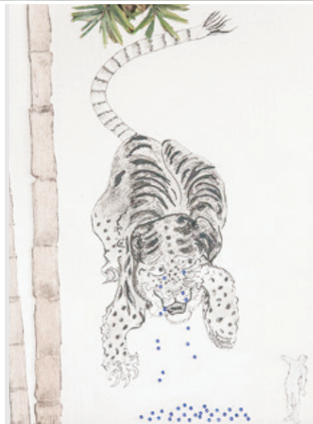
Obra expuesta. Las lágrimas de un tigre indio, 2017. Dibujo de Pierre Desfons. Tinta china, grafito, collage, 36 x 26 cm. © Michel Bellaiche.

Droopy fue un amor a primera vista y el primer perro que adopté de un