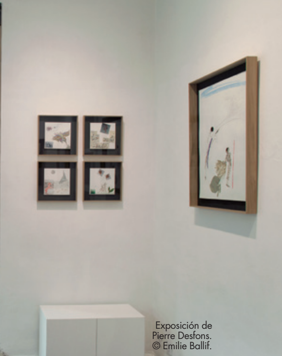
Exposición de Pierre Desfons.

en el mundo del arte con la apertura de nuevas galerías, así como con la inauguración reciente de la Fundación Van Gogh y la Fundación Luma. Numerosos artistas y jóvenes promesas del arte se reúnen cada año en esta ciudad, por lo que tenía sentido establecerse aquí.