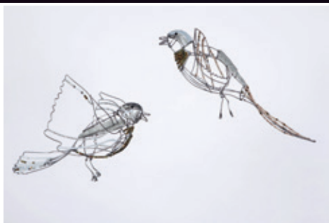
Obra expuesta. Esculturas de Marie Christophe, 2015. Alambre, cuentas de cristal de 23 cm cada una. © Marie Christophe.

Siguiendo el caso de los dos países, el número de abandonos de perros