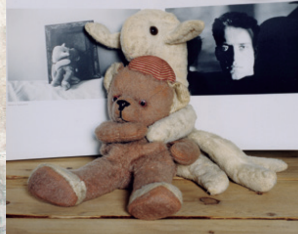
Belours + Agneaudoux, 55 ans. Confidants d'Hervé Guilbert. París, 2010. Impresión de plata en papel Kodak Endura Premier, 40 x 40 cm.

PRÓXIMA EXPOSICIÓN DEL 2 DIC AL 6 ENE Sylvie Huet