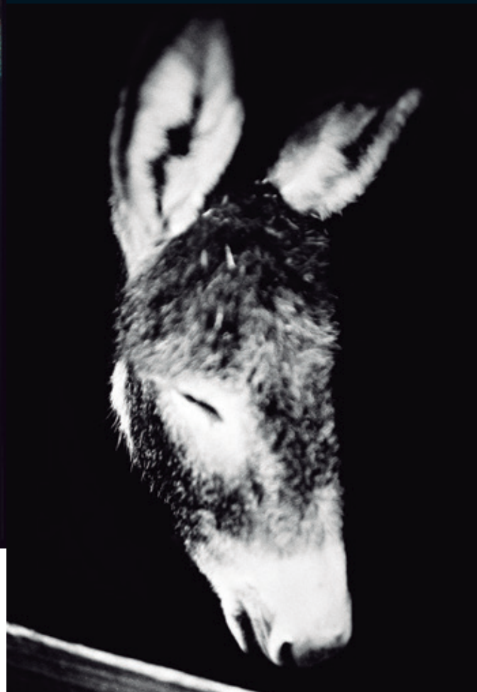
Obra expuesta. Ardenne belge, 2008. Fotografía de Jean-François Spricigo. Filmación de película, impresión de inyección de tinta, 60 x 90 cm. © Jean-François Spricigo.

Estoy convencida de que para combatir el abandono animal se necesita educar al ser humano y hacerle comprender