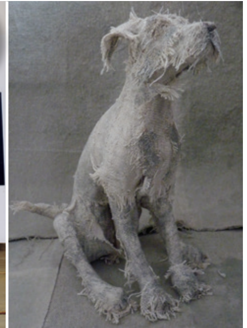
Obra expuesta. Small sitting dog, 2015. Escultura de Holy Smoke. Textil. Técnica mixta, 22 cm. © Wyn Griffiths.

Parisina de sangre y con descendencia polaca, Isabelle estudió Escuela de Piano en París sin nunca ejercer como tal, trabajó como fotógrafa del magazine Egoïste, fue corresponsal de prensa de las galerías de foto de la FNAC y responsable de la comunicación del Festival Internacional de Arte Contemporáneo de Arles, «A-Part».