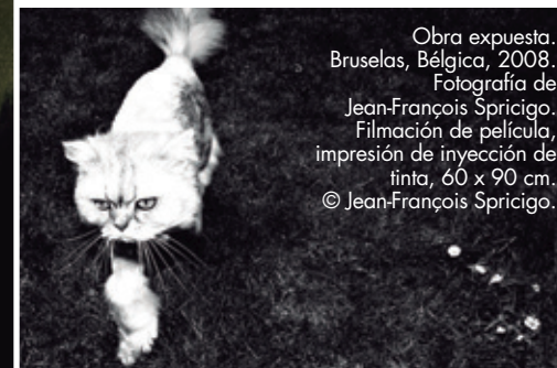
Obra expuesta. Bruselas, Bélgica, 2008. Fotografía de Jean-François Spricigo. Filmación de película, impresión de inyección de tinta, 60 x 90 cm. © Jean-François Spricigo.

Tuvo un papel vital en mi vida y con él descubrí lo que significa la lealtad y el amor incondicional. El vacío y la tristeza que dejó, me hizo adoptar a mi segundo perro, Joy, una mezcla de caniche y labrador, recién llegado a Arles desde tierras inglesas.